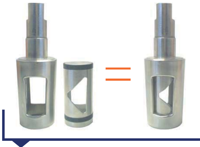
Käfig plus Regelkegel